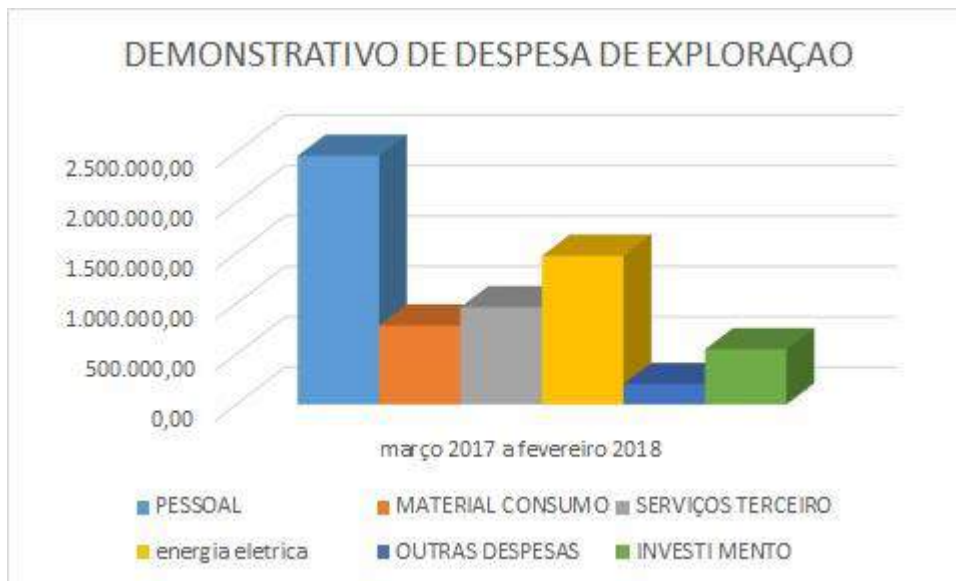
gráfico 3: Demonstrativo de despesas de exploração 2017